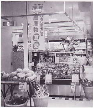
「よがんす可部」アルパーク天満屋へ出店 (安佐北区可部地区・生産者34人)