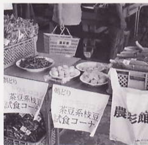
朝どり枝豆の試食販売開催：農彩館