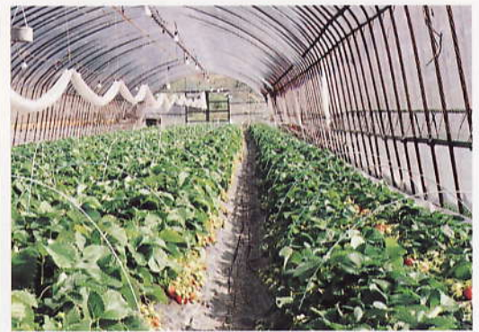
イチゴ：ハダニの天敵(チリカブリダニ)を利用した栽培