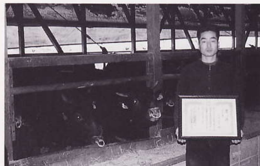
県畜産共進会「枝肉の部」優秀賞入賞 （安佐北区白木地区）