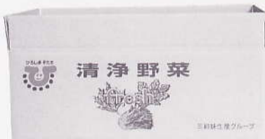
“ひろしまそだち”マーク入りケースでコマツナを出荷 三姉妹生産グループ (安佐北区安佐地区)