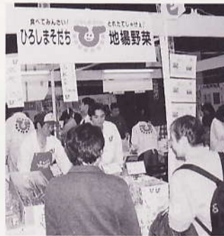
フードフェスタ広島2000 “ひろしまそだち”朝市コーナーでの販売 場所：グリーンアリーナ