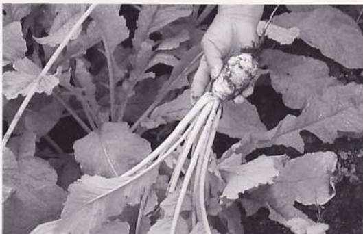
おろしだいこん雪美人出荷 （安佐北区高陽地区）