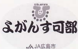
よがんす可部 ひろしまそだちマーク入り新デザインシールの作成