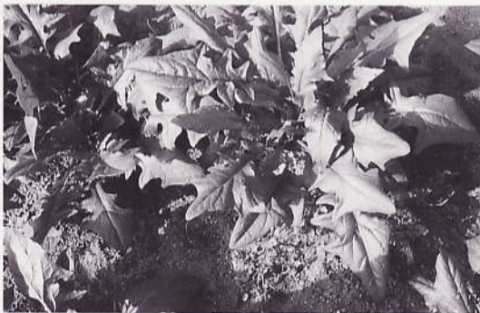
福王寺ほうれん（日本種ほうれんそう）の復活 （安佐北区可部地区）