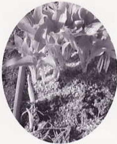
ウルイの籾殻を使った栽培