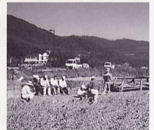
豆腐料理店と大豆の契約栽培 (安佐北区白木地区)