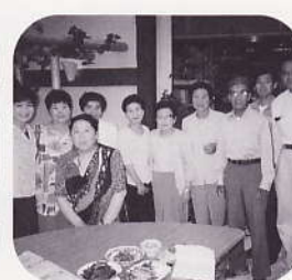
安佐北区安佐地区行根 インゲングループ (平成11年7月12日)