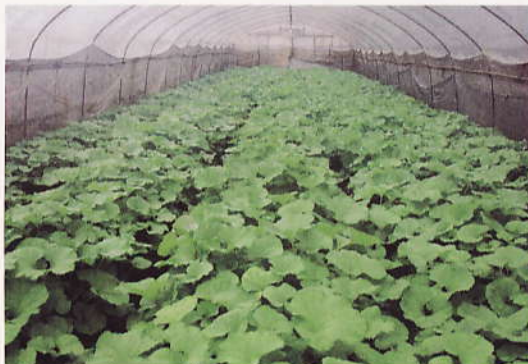
フキ：病害虫の多い夏に株を掘り上げ冷蔵し、被害を回避した栽培