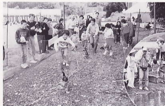
好評 アイガモレース アイガモ米のオーナー制度・感謝祭開催 （安佐北区白木地区）