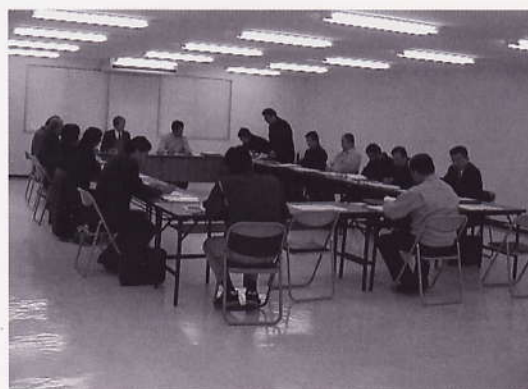
基準検討委員会開催（平成12年3月3日）