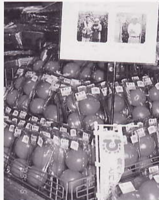
減農薬朝どりトマト出荷 (安佐北区高陽地区・生産者3人)