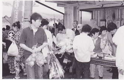
直売店「安芸のふる郷」オープン (安芸区阿戸町川筋地区・生産者58人)

新鮮で安全な農産物を、消費者が安心して求めることができるよう生産者の顔の見える販売方法を進めています。