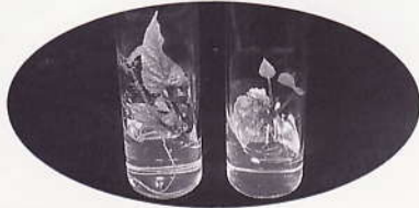
紫いものメリクロン苗開発普及（収量多い） メリクロンによる無病化苗の開発普及