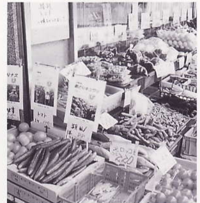
朝どり野菜出荷：市内6店舗 (安佐南区佐東地区・生産者4人)