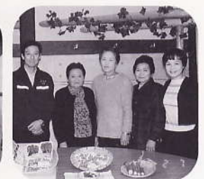
安佐北区安佐地区生砂 タラノメグループ (平成12年2月7日)