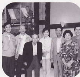
安佐北区白木地区 長ナスグループ (平成11年6月28日)