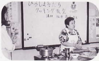
“ひろしまそだち”クッキング教室開催 市内5か所の公民館で実施

さまざまな方法により消費者に“ひろしまそだち”を知っていただくよう努めています。