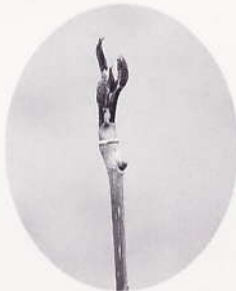
コシアブラの長い穂木を使った栽培 山菜の促成栽培技術確立