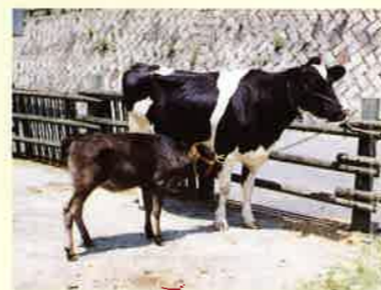
乳牛から生まれた和牛子牛