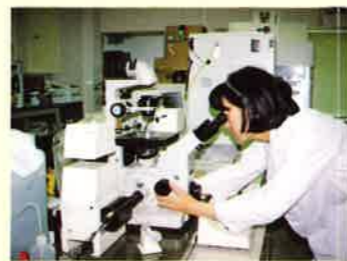
受精卵移植の検査室