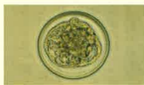
受精卵の顕微鏡写真