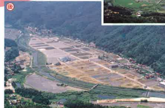
工務課基盤整備係