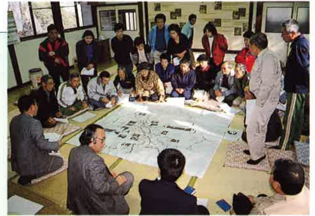
計画課構造改善係