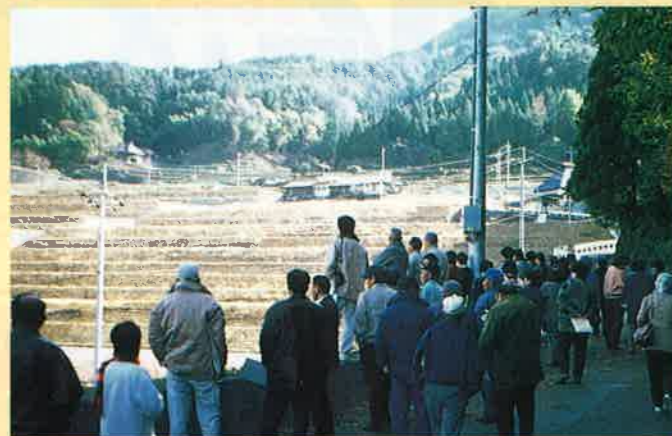
▲工事中のほ場整備地区(安佐町明見谷)を視察された、沼田町阿戸地区のみなさん