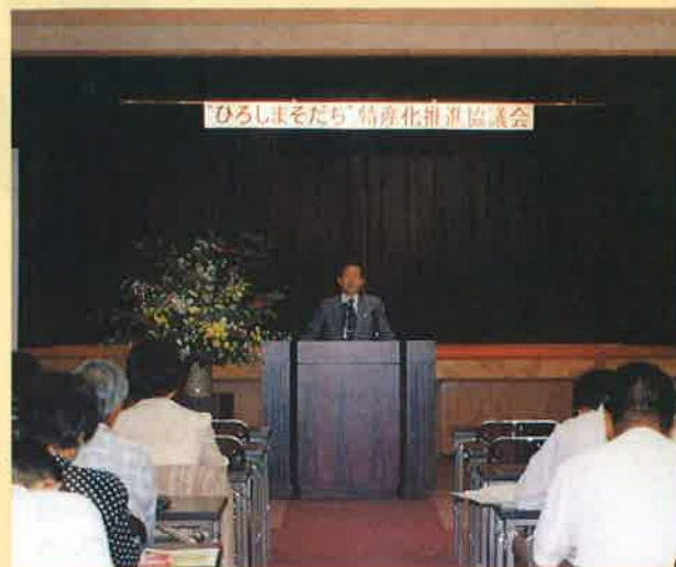
▲認証制度における会議の様子

平成7年9月26日(火) J A広島市中筋支店で“ひろしまそだち”特産化推進協議会が開催されました。