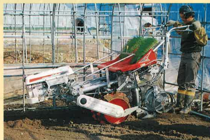
▲ネギ栽培の効率化が期待されるネギ移植機