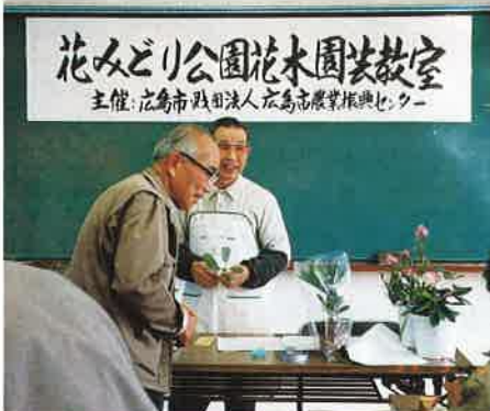
◀花木園芸教室風景

花みどり公園では、花木、草花の栽培や繁殖についての講習会のほか、花木園芸教室を開いています。平成7年度には庭木・シヤクナゲの栽培を中心とした内容で3回開き、好評でした。平成8年度も引き続き3回程度行う予定です。ぜひ御参加ください。また、世界のシヤクナゲを集めたシヤクナゲ展と花木展を4月27日～5月6日に開催する予定です。なお、詳しいことは市の広報紙に掲載します。