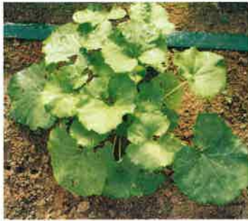
▲将来有望なバイオ水ブキ

園芸課では、ハウス向きの「愛知早生」に続いて、露地向きの水ブキのバイオテック苗の供給を始めました。水ブキは「愛知早生」ほど大きくはなりません、緑色が鮮やかで、あくが少なく、良質のふきのとうも収穫できます。主に安佐北区の産地に供給しています。