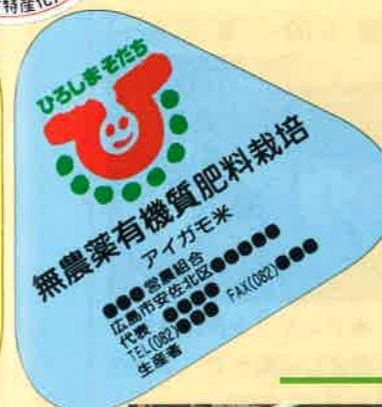
▲店頭表示が始まる地場産認証マーク