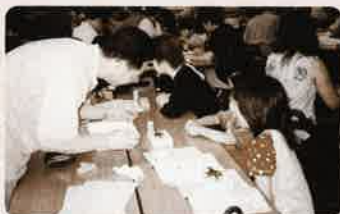
カブトムシの標本を作る参加者