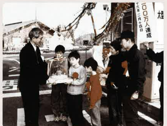
記念品を受け取る入園300万人目のご家族