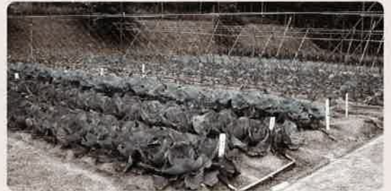
直売向け野菜の栽培ほ場