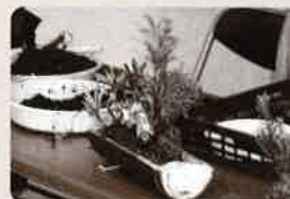
出来上がったコケ玉作品