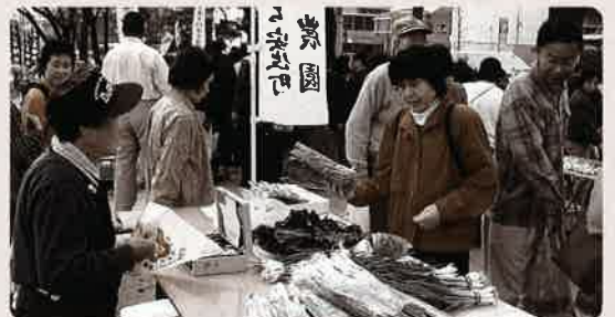
開催中の「ひろしま朝市」