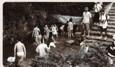
魚のつかみ取りに夢中の子供たち