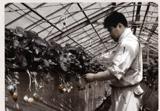
立ったままで収穫できる高設栽培

高設栽培とは、栽培管理から収穫まで立ったままで作業でき、体への負担が軽減できる方式です。本センターでは、広島型の高設イチゴ栽培の展示をしています。簡単な資材を利用しているため、経費は約10万円/a(骨組み+用土)です。平成16年度に品種展示を実施します。