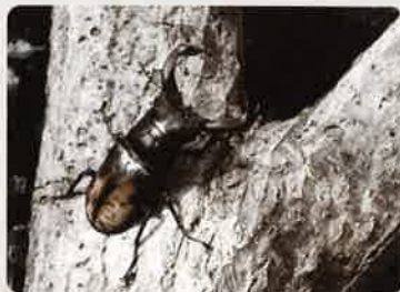
セアカフタマタクワガタ

世界の生きたカブトムシやクワガタムシが大集合。目を見張る造形美や、大きさ、色彩をお楽しみください。