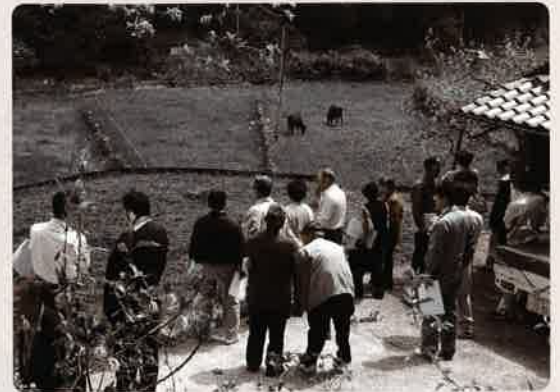
和牛放牧の視察をする組合員

また、総会では、従来から取り組んでいる優良なめす牛を地元に残すなどの成果があり、平成15年度の出荷子牛価格が三次市場平均価格を上回ったことが報告されました。今後もより市場性の高い子牛の生産に努めることが確認されました。