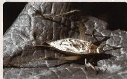
秋の鳴く虫 マツムシ

秋の鳴く虫たちを間近に見ることが出来ます。声は聞こえても姿は見たことがないという虫の正体が、わかるかもしれません。