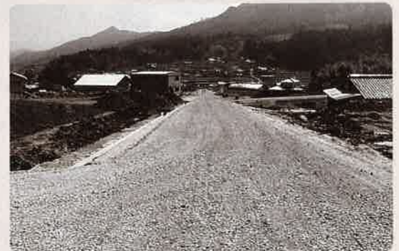
幹線道路整備中の上垣内地区

工事中の上垣内地区は、地元待望の幹線道路を併せて整備します。平成15年度に着手し、平成19年度までの5年間で完成する予定です。