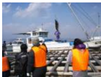
3月 収穫作業の見学