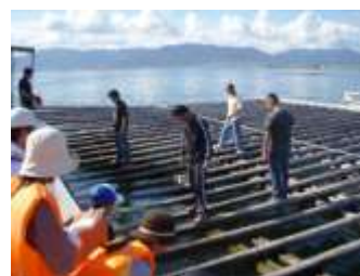
9月 本垂下作業の見学