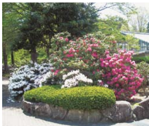
170品種5500本のシャクナゲがお待ちしております