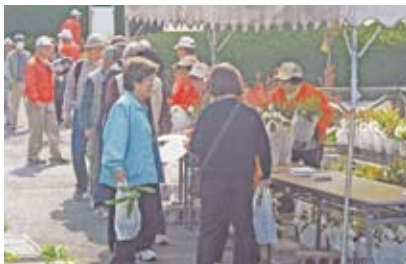
シャクナゲの苗の無料配布

入し、4月15日(金)までに下記へ。 〒731-3362 広島市安佐北区安佐町久地2411-1 花みどり公園 園 同園 (☎ 837-1247)