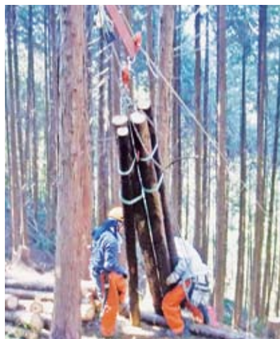
軽架線による集材