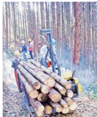
林内作業車による集材

していただきました。軽架線やロープウインチを利用した間伐材の搬出は、最近始まった方式のため、その技術の修得には、現場で経験を積むしか方法がありません。」