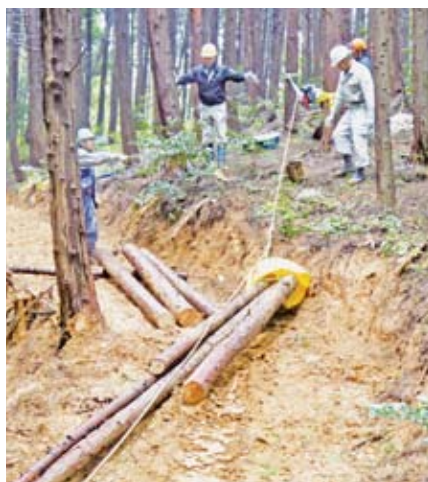
ポータブルウインチによる地引集材

研修は14回開催し、広島市里山整備士などの森林ボランティアとして経験を積んだ5名が受講。土佐の森方式と呼ばれる、簡易な機械を