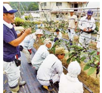
「ふるさと帰農」支援