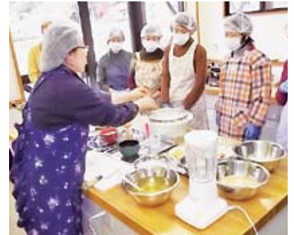
キムチ作り講習会（三田）