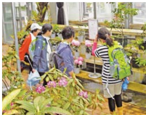
ボランティアガイドがご案内します