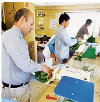
“ひろしま活力農業” 経営者育成