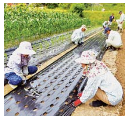
“チャレンジ”女性農業者育成