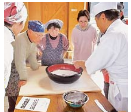
そば打ち体験会（見張）