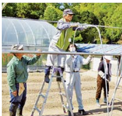
「スローライフで夢づくり」新規就農者育成