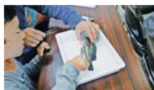
魚のからだと年齢

所、②氏名(ふりがな)、③電話番号、④学年、⑤保護者氏名、⑥教室名を記入して、各教室の締切日までに下記へ。消印有効。 〒733-0833 広島市西区商工センター八丁目5-1 広島市水産振興センター 普及指導課 園 同課 (☎277-6609)