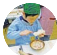
かまぼこ作り体験