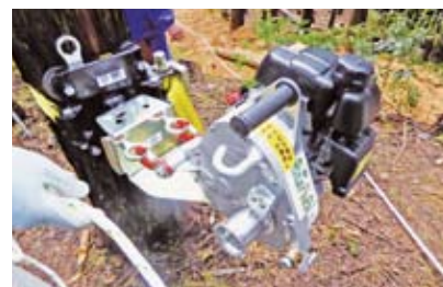
ポータブルウインチ