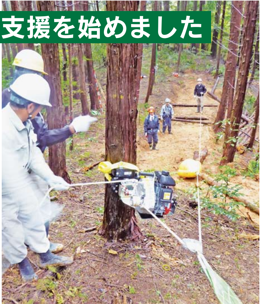
簡易な機械を使った「土佐の森方式」による搬出作業

このため、広島市では木材の幅広い利用促進を目指して、森林内に放置されている未利用材を山林所有者自らが搬出する、いわゆる自伐林業によって、再生可能な木質バイオマスとして有効活用する仕組みづくりに取り組むことになりました。