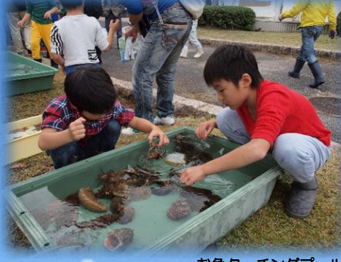
お魚タッチングプール