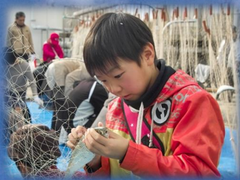
刺網から魚をはずす体験