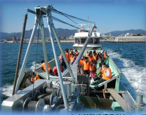
かき養殖漁場見学クルーズ