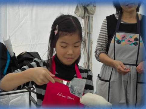
かまぼこ作り体験