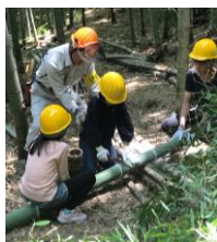
小学生を対象とした竹の伐採指導の様子