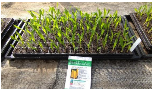
サニーショコラレオ