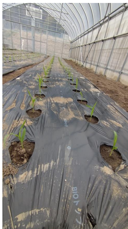
定植後の様子（3月9日）