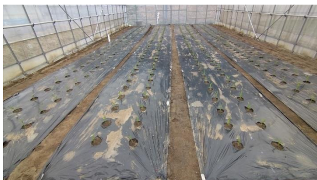
定植後の様子（3月9日）