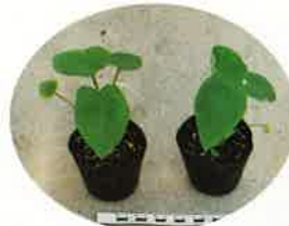
バイテク苗（石川早生）