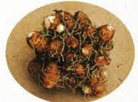
バイテク苗から収穫された子いも