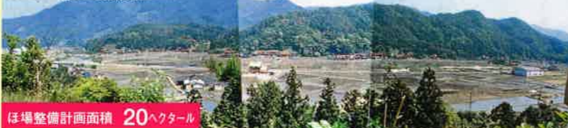
ほ場整備計画面積 20ヘクタール