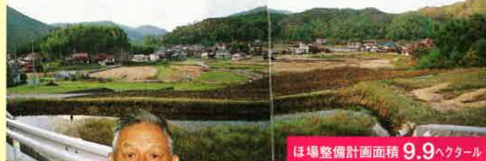
ほ場整備計画面積 9.9ヘクタール