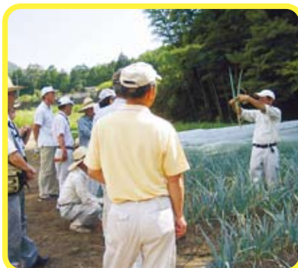
作物の生育状況や管理方法を実際のほ場で説明(スロー、ふるさと、チャレンジ)

農業振興センターでは、昨年の5月から毎月1回、当センターで研修を受けた研修修了生のための講習会を始めました。活力とスローライフ・ふるさと帰農・チャレンジ女性の2コースに分かれて、作物の栽培に関する講義を行っています。これまでに合計279人(11月現在)の修了生が受講しました。