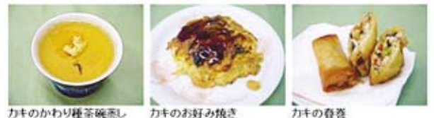
カキのかわり種茶碗蒸し カキのお好み焼き カキの巻寿司