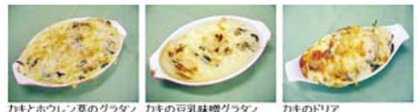
カキとホウレン草のグラタン カキの豆乳味噌グラタン カキのドリア