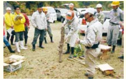
しいたけ栽培の説明