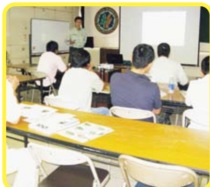
毎月テーマを変えて肥料や土づくりについて講習(活力)