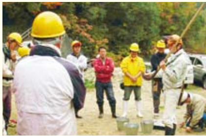
刃物の手入れ指導