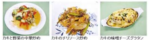
カキと野菜の中巻炒め カキのチリソース炒め カキの味噌チーズグラタン