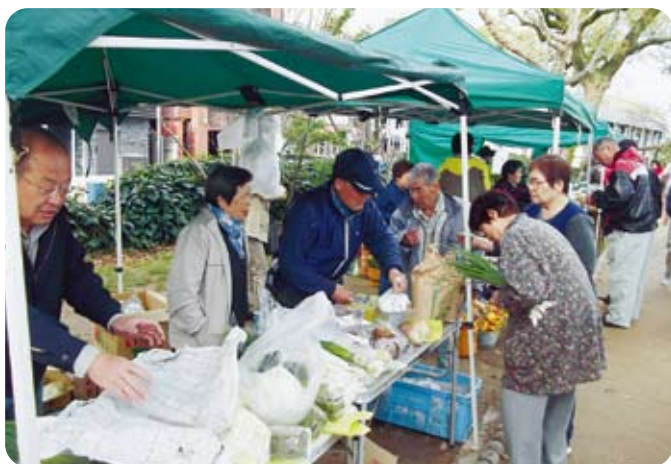
常連のお客さんとの会話も楽しみのひとつ