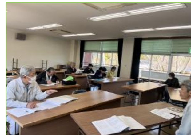
総会で今年度の計画を決定しました。

「2026春のシャクナゲふれあい祭り」では、講座や園内ガイドにご協力いただき、ありがとうございました。園内ではシャクナゲ等のたくさんの花が開花し、来園者が写真を撮る姿が多く見られました。年々気温が上昇しており、シャクナゲの開花が早まっているため、鑑賞期間が短くなっています。ファンクラブの皆様、来園の際には、体調にお気をつけてお越しください。