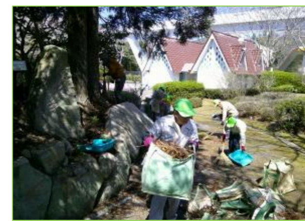
来園者を迎えるため園内の一斉清掃を行いました。