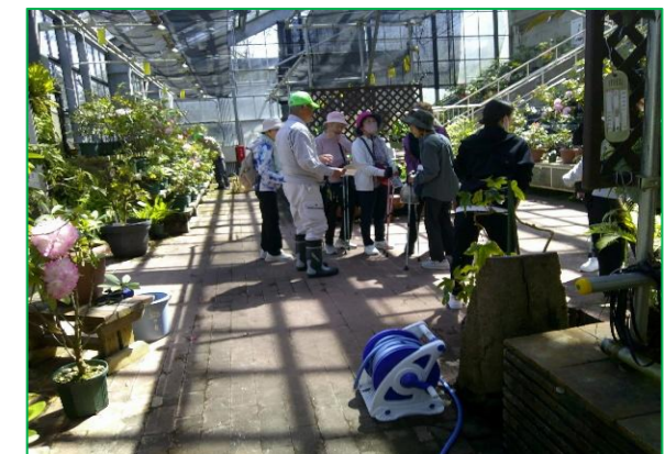
シャクナゲの質問する来園者に、丁寧に説明をされました。