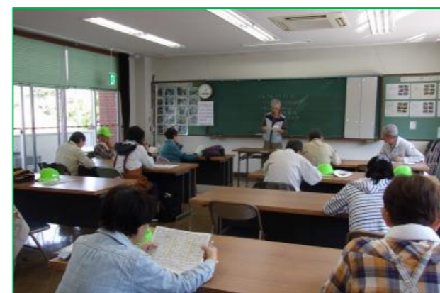
園内めぐりガイド研修では、講師からシャクナゲの花について説明を受けました。