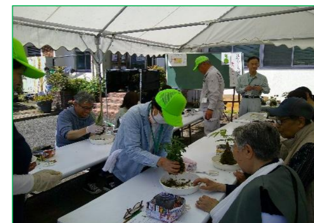
「春のコケ玉づくり」講座は今年も多数の応募がありました。丁寧なご指導をありがとうございました。